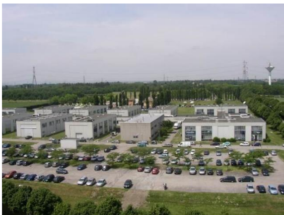
Veduta aerea della Sede Scientifica di Ingegneria.

Nel caso in cui si venga a verificare una situazione di emergenza sanitaria, le sedute di laurea potrebbero svolgersi in modalità a distanza. Le informazioni in merito a tali disposizioni emergenziali saranno pubblicate sul sito web del Dipartimento di Ingegneria dei Sistemi e delle Tecnologie Industriali disti.unipr.it .