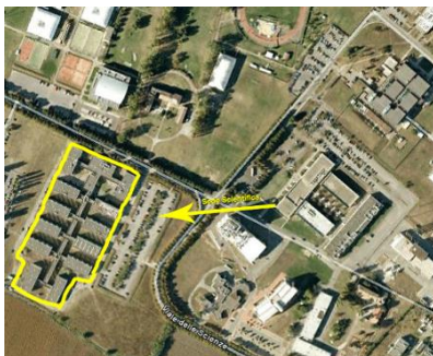
Veduta aerea della Sede Scientifica di Ingegneria

Maggiori informazioni sull'iscrizione e sulla verbalizzazione online si trovano alla pagina web: www.unipr.it/esami-di-profitto .