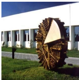
Scorcio della Sede Didattica di Ingegneria