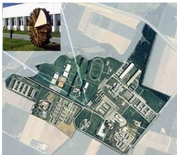
Veduta aerea del Campus dell'Università di Parma

tel. 0521 906538, e-mail: disti.didattica.@unipr.it