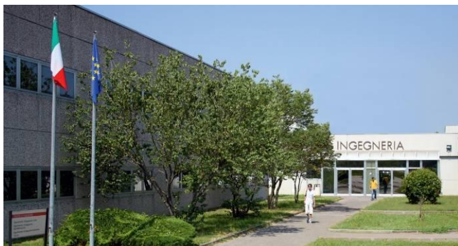
Ingresso della Sede Scientifica di Ingegneria