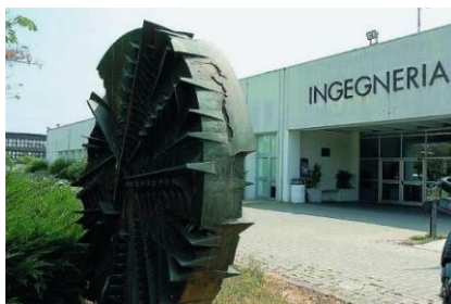
Ingresso alla Sede Didattica di Ingegneria